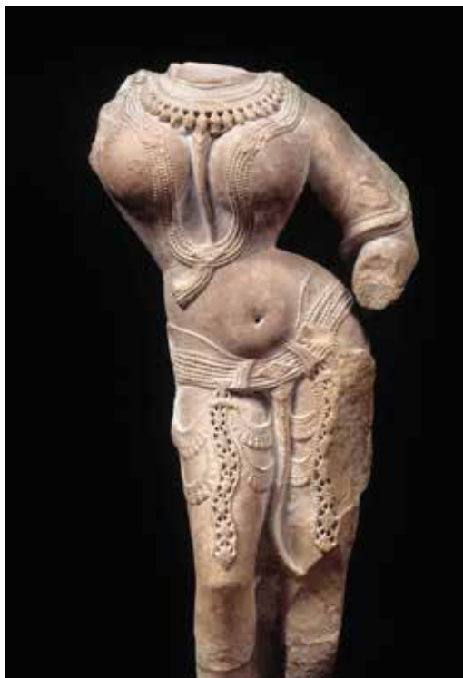
Fig. 1. Persisk skulptur från 400-talet. Divinité féminine, Östasiatiskt Museum, Paris.

fler kvinnor yrkesverksamma och 1919 fick de rösträtt. En ny värld öppnade sig för dem.