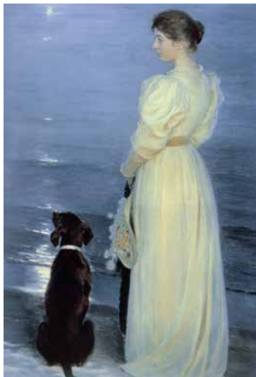
Fig. 3. Kvinnors midja har framhävt i många konstverk. Här är det Skagenmålaren Peder Severin Krøyer, 1851–1909, som porträtterat hustrun Marie Krøyer, född Triepcke, som också var utbildad konstnär.

Parallellt med modeskaparnas föreställningar om kvinnors utseende pågår i verkligheten en ökning av midjeomfånget. Denna ökning är inte direkt korrelerad till den allmänna viktökningen som pågått tre–fyra decennier.