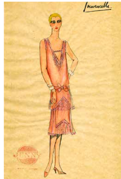
Fig. 2. Under 1920-talet "försvann" midjan i kvinnomodet för en kort period. Annars har midjan framhävt både i äldre och i modern klädsel. Bild från utställningen Mode utan midja på Malmö Museum, 2012.

Så skrev den franska författarinnan Simone de Beauvoir. Hon ville framhäva det omöjliga i att vara moderiktig och elegant för de flesta kvinnor som inte hade mode som sin huvuduppgift. Det var ett arbete i sig, ett som förslavade kvinnan. Den yrkesarbetande kvinnan hade inte tid med detta.